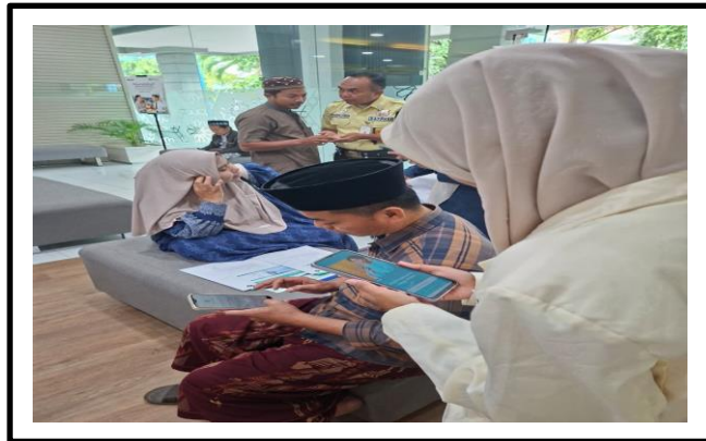
Gambar 3 Mahasiswa membantu nasabah mengakses layanan digital via ponsel.