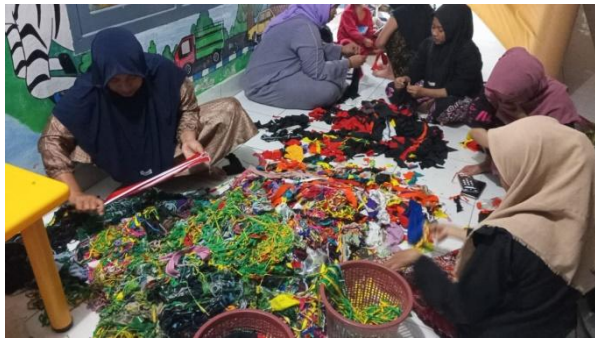
Gambar 1. Kegiatan Pemberdayaan Wali Murid Tarbiyatul Muhtadiin Desa Batu Bintang dalam Pembuatan Lokakarya dan Media Edukatif

Metode ini memastikan bahwa wali murid bukan hanya objek, tetapi juga subjek aktif dalam proses pemberdayaan, sesuai dengan prinsip PAR yang kolaboratif, partisipatif, dan transformatif (Kemmis & McTaggart, 1988).