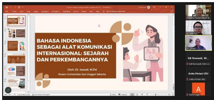
Gambar 2. Penyampaian Materi dalam Kegiatan Webinar