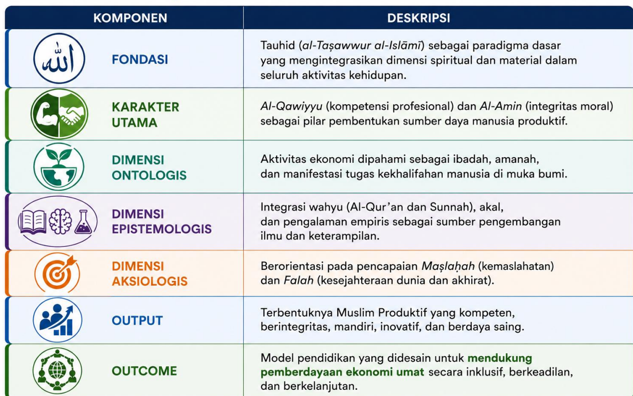
Tabel 1. Komponen Model Pendidikan Tauhid-Produktif

Tabel 1 menunjukkan bahwa Model Pendidikan Tauhid-Produktif dibangun atas tujuh komponen utama yang tersusun secara sistematis dan saling berkaitan. Fondasi model ini adalah tauhid ( al-taṣawwur al-islāmī ), yaitu paradigma dasar yang mengintegrasikan dimensi spiritual dan material dalam seluruh aktivitas kehidupan. Paradigma tauhid tersebut menjadi landasan pembentukan karakter utama berupa al-qawiyu dan al-amin , yang merepresentasikan sinergi antara kompetensi profesional dan integritas moral sebagai prasyarat terbentuknya sumber daya manusia yang produktif, amanah, dan bertanggung jawab.